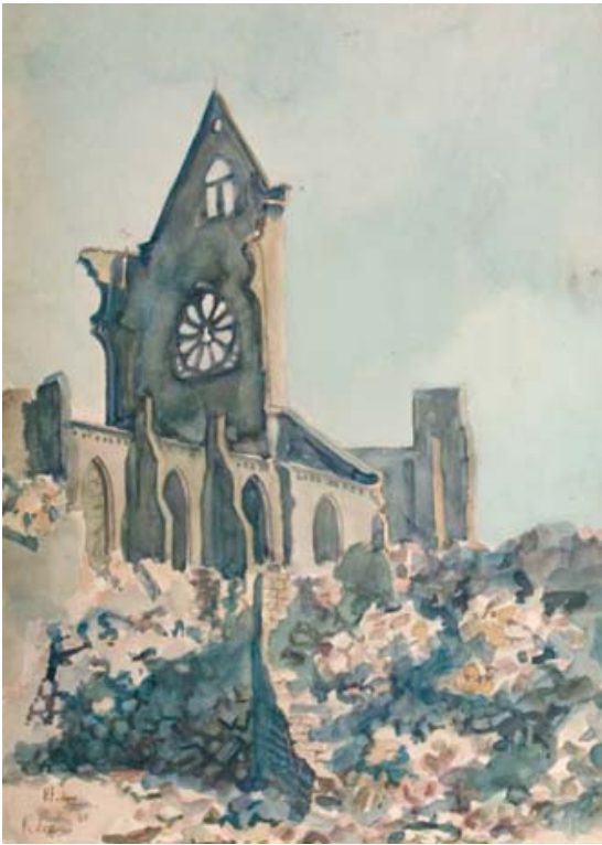
Henk Fortuin. Het verwoeste Rotterdam, 1940 (aquarel, 34,5 x 47 cm)