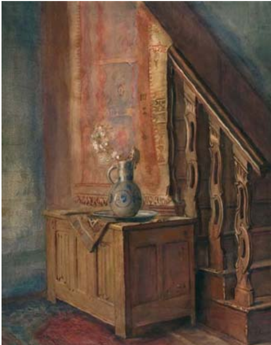
Henk Fortuin. Academieopdracht, 1938 (aquarel, 42,5 x 53 cm)