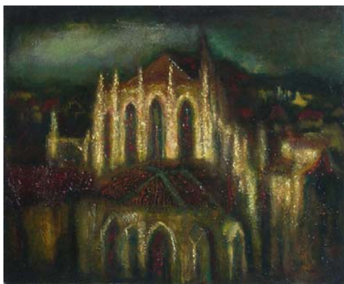
Henk Fortuin. Kathedraal van Sarlat, jaren tachtig (olie op paneel, 65 x 79 cm)