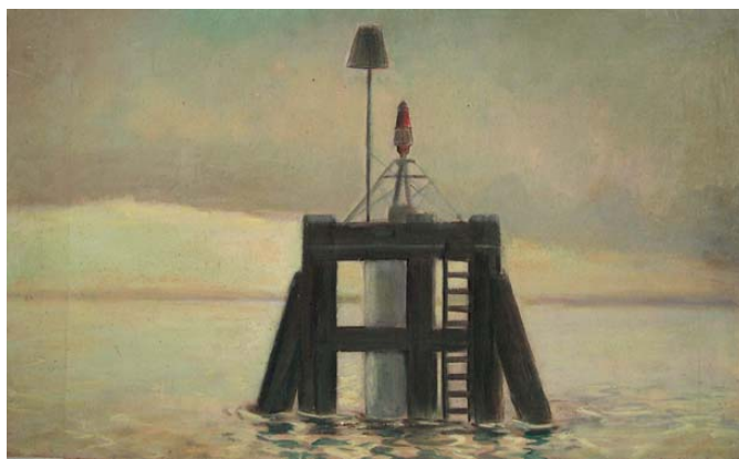
Henk Fortuin [geen nadere gegevens bekend]