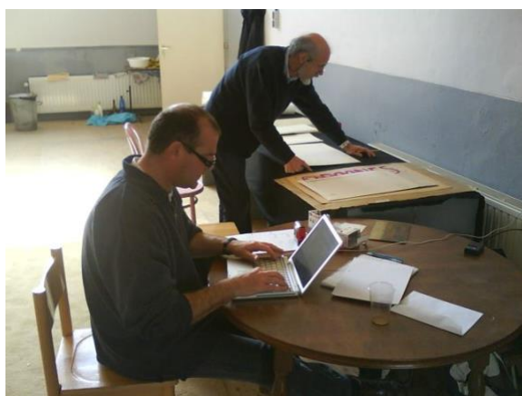
Archiveren en beschrijven