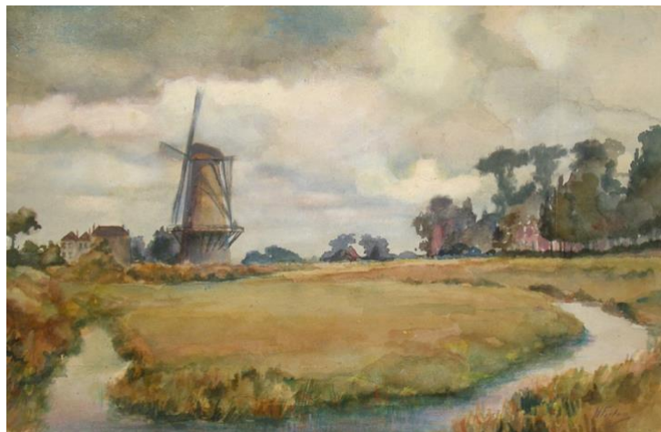
Molen De Hoop